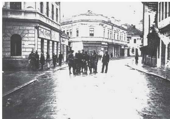
Grupa boraca 1. vojvođanske brigade u oslobođenoj Tuzli, oktobar 1943. godine.