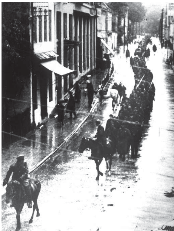
Ulazak partizanske komore u oslobođenu Tuzlu, 1943