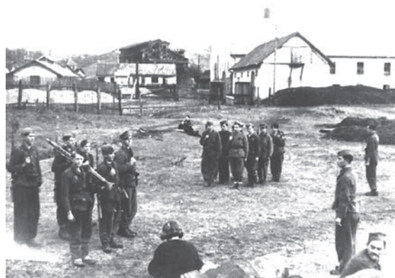
Dolazak partizanskih jedinica na formiranje 27. NOU divizije Simin Han kod Tuzle, oktobar 1943. godine.