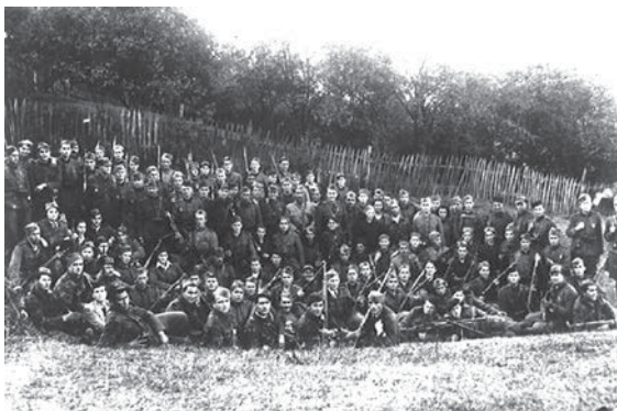
Borci pratećeg bataljona 3. korpusa, Tuzla 1943. godine.