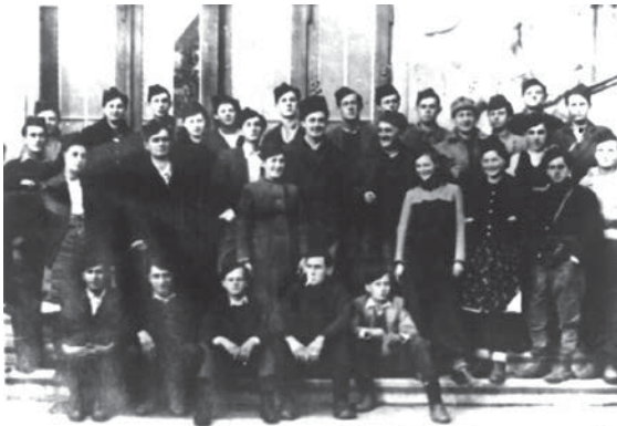
Članovi kulturno – umjetničke ekipe iz Bijeljine u oslobođenoj Tuzli 1943. godine.