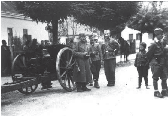
Artiljerija 16. vojvođanske divizije i članovi Štaba 1. vojvođanske brigade u oslobođenoj Tuzli, oktobar 1943. godine.