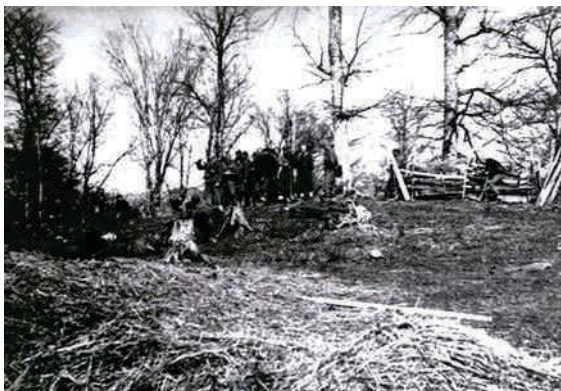
Borci 4. bataljona 1. vojvođanske brigade pred napad na neprijateljsko uporište u Tuzli, 1943. godine.