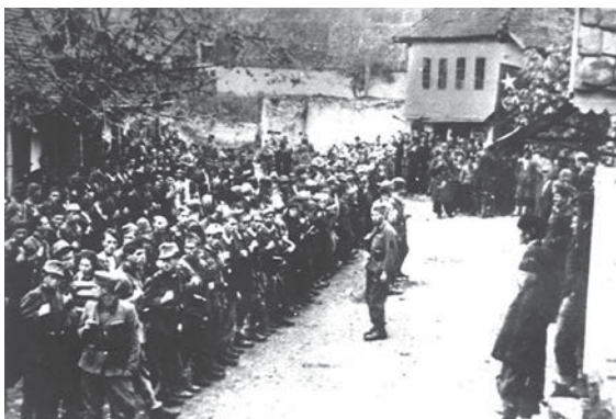
2. bataljon 1. vojvođanske brigade na Majevici pred pokret na Tuzlu, 1943. godine.

Obzirom da je Tuzla za njemačkog okupatora bila veoma važan strateški čvor i ekonomski centar regije, njemačke neprijateljske jedinice su nakon dužih priprema, ponovo krenule na Tuzlu sa cijelom pješadijskom divizijom i motorizovanim pukom, te je nakon četrdeset dana života u slobodi, grad ponovo pao u ruke neprijatelja. Tuzla će ostati okupirana do 17. septembra 1944. godine, kada će po drugi put i konačno biti oslobođena.