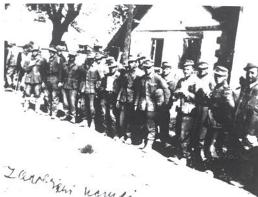
Zarobljeni njemački vojnici u borama za prvo oslobođenje Tuzle, oktobar 1943. godine.