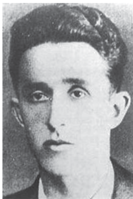
Mahmut Bušatlija Buš narodni heroj

je vrlo brzo uspio da konsoliduje partijsku organizaciju u Tuzli i postavi nove uslove rada. Sredinom novembra 1942. godine, Škraba je zamijenio Vladimir Perić Valter, koji je na ovoj dužnosti ostao do kraja jula 1943. godine, kada po nalogu KPJ odlazi na ilegalni rad u Sarajevo, gdje je postao sekretar MK KPJ Sarajevo. Nakon odlaska Valtera, cjelokupnim radom NOP-a, u narednom periodu, rukovodio je MK KPJ.