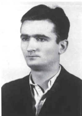
Vladimir Perić Valter narodni heroj