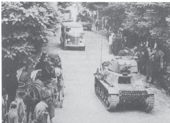
Ulazak njemačkih okupatorskih snaga u Tuzlu 15. aprila 1941. godine

Šestog aprila 1941. godine Njemačka je, bez objave rata, napala Jugoslaviju i bombardovala Beograd, čime je počeo rat u Jugoslaviji (1941. – 1945. ). Bosna i Hercegovina je 1941. godine pripala interesnim sferama nacističke Njemačke i fašističke Italije i ušla u sastav Nezavisne države Hrvatske (u daljem tekstu NDH) koja je formirana 09.04. 1941. godine. Na čelu NDH se nalazio Ante Pavelić i ustaše. Njemačke okupacione snage su ušle u Tuzlu 15.04.1941. godine.