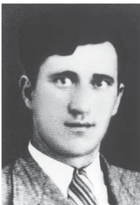
Mehmed Memo Suljetović

Početak septembra 1941. godine u Tuzlu je stigao ustaški pokretni prijevratni sud. Tom prilikom na smrt su osuđeni: Enver Šiljak, Memo Suljetović i Rudolf Vikić. Strijeljani su javno zajedno 5. septembra 1941. godine u dvorištu tuzlanskog zatvora „Štok“. Oni su bili prvi istaknuti komunisti Tuzle koji su bili osuđeni na smrt. Na ovaj način, ustaške vlasti su htjele izazvati strah kod stanovništva i njihovim streljanjem ukazati šta čeka sve pristalice antifašističkog pokreta. Poslije završetka II svjetskog rata, uz prisustvo velikog broja građana i dužne počasti, njihovi posmrtni ostaci su sahranjeni u zajedničku grobnicu u Kreki.