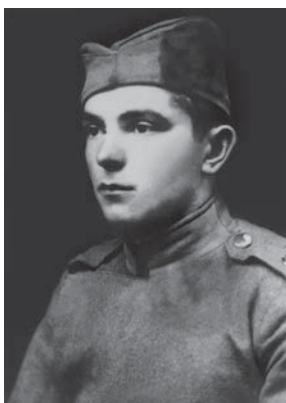
Albin Herljević narodni heroj